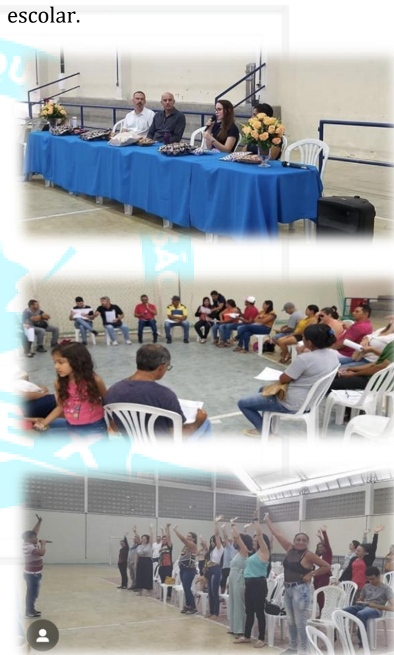
Fotos 01,02 e 03. Encontro Família e Escola CAVN, 22 de maio de 2023.

No ultimo dia 22 de maio, foi realizado o Encontro Família e Escola do CAVN, momento importante para a comunidade, fortalecendo a interação entre familiares, docentes, servidores e o ambiente escolar.