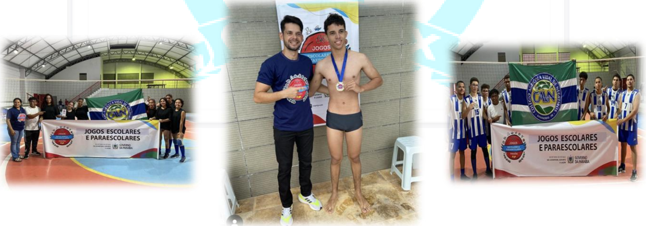
Fotos 17, 18 e 19. Premiações CAVN – Voleibol Feminino; Medalha na Natação e Voleibol Masculino.

Coordenação do Curso Técnico em Nutrição