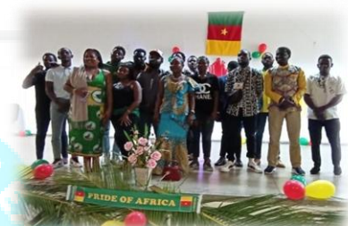
Fotos 04, 05, 06, 07, 08 e 09. Dia de Camarões, CAVN 2023.