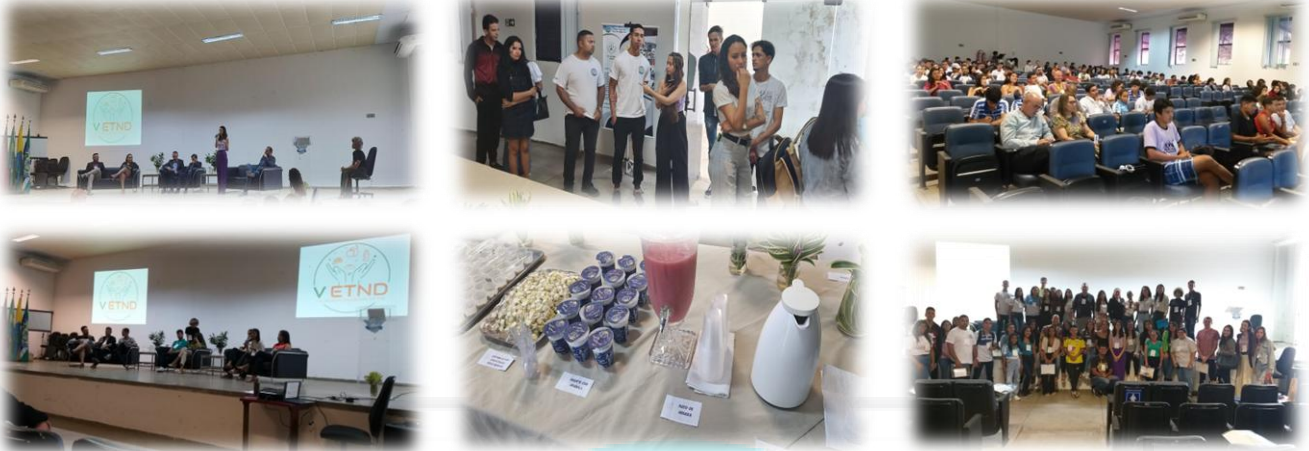
Fotos 10, 11, 12, 13, 14, 15 e 16. V ETND – Encontro do Técnico em Nutrição e Dietética, CAVN 2023.

O CAVN comemorou o dia do Técnico em Nutrição e Dietética com um evento lindo, onde a atuação e a importância do profissional foi apresentada para a comunidade interna e externa do CAVN/CCHSA/UEPB. Contamos duas palestras, uma sobre Regulamentação da profissão e outra com o tema "Como alavancar a carreira profissional", além de um emocionante bate-papo com egressos do curso falando de suas trajetórias. Tivemos sorteio de brindes e um coffee-break especial, planejado e preparado pelos estudantes do curso e alguns setores do campus. Finalizamos o dia com a exposição de trabalhos nas quatro áreas de atuação do TND e um forró pé de serra. Um evento construído por muitas mãos, discentes, servidores técnicos e terceirizados e docentes.