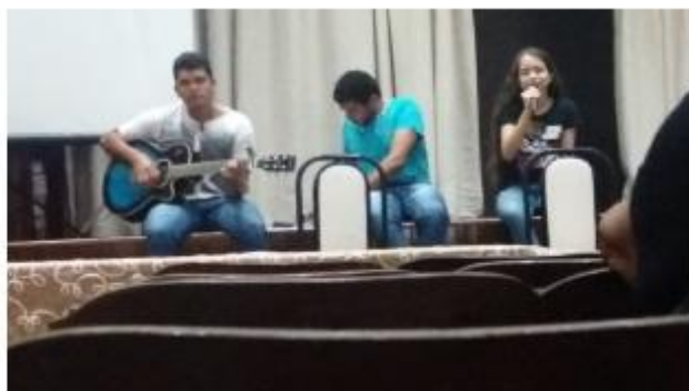
Foto 04. Encontro da Família Escola no CAVN, 2019.