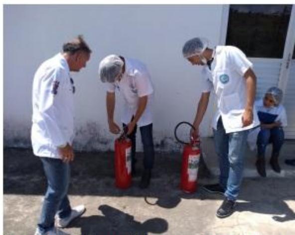
Foto 19. Minicurso Segurança do trabalho na XXVI EXPOTEC/CAVN 2019.

Boletim Informativo da Coordenação Geral de Pesquisa e Extensão - Edição 17ª EXPOTEC