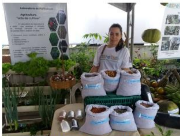
Foto 18. XXVI EXPOTEC/CAVN 2019.