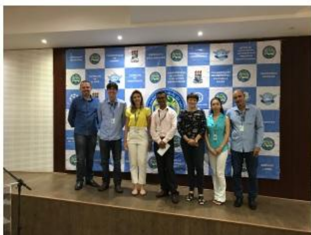
Foto 01. Encontro da Família Escola no CAVN, 2019.

O Colégio Agrícola Vidal de Negreiros realizou no dia 28 de setembro o II Encontro Família Escola de 2019. Com o objetivo de reunir educadores docentes, educadores não docentes, pais, mães, responsáveis e estudantes do CAVN para discussões e interações com vistas a melhoria contínua do processo de ensino do CAVN e de aprendizagem dos estudantes.