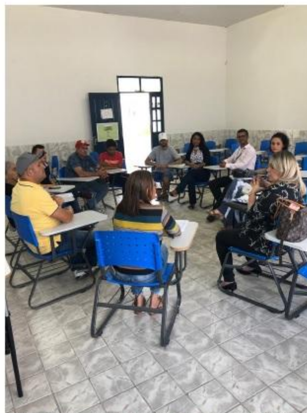
Foto 02. Encontro da Família Escola no CAVN, 2019.

A educação é um processo que continua ao longo de toda a vida, mas os pilares estão na educação da família e da escola.