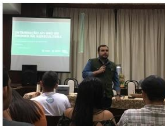
Foto 07. Comemoração ao Dia do Técnico em Agropecuária, 2019.