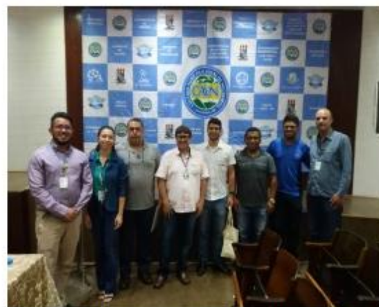
Foto 08. Comemoração ao Dia do Técnico em Agropecuária, 2019.