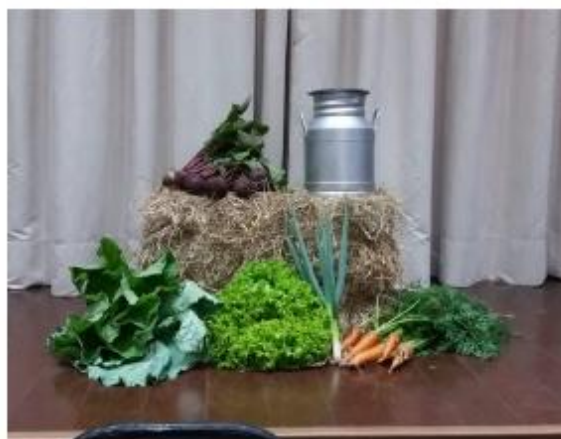
Foto 06. Comemoração ao Dia do Técnico em Agropecuária, 2019.

No dia 03 de outubro foi comemorado no Colégio Agrícola Vidal de Negreiros esta data tão especial. O evento contou com palestras e mesas redondas sobre assuntos da atualidade do universo da agropecuária.