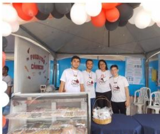
Foto 15. XXVI EXPOTEC/CAVN 2019.

Boletim Informativo da Coordenação Geral de Pesquisa e Extensão - Edição 17º EXPOTEC