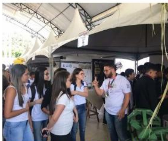
Foto 16. XXVI EXPOTEC/CAVN 2019.