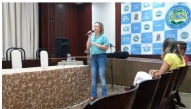
Foto 03. Encontro da Família Escola no CAVN, 2019.

Boletim Informativo da Coordenação Geral de Pesquisa e Extensão - Edição 17ª EXPOTEC