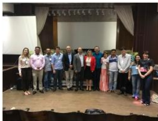
Foto 12. II Fórum de Ensino Básico e Profissional/CAVN 2019.