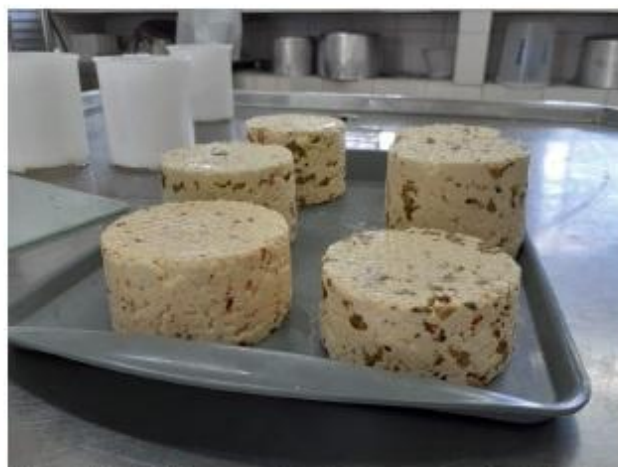
Foto 22. Minicurso Queijos artesanais XXVI EXPOTEC/CAVN 2019.