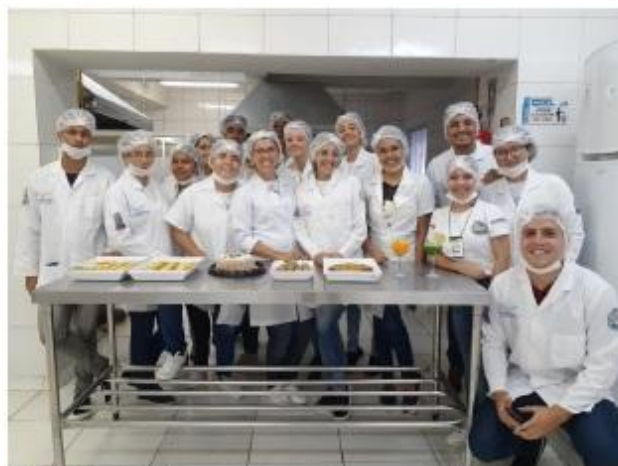
Foto 21. Minicurso Aproveitamento integral dos alimentos na XXVI EXPOTEC/CAVN 2019.