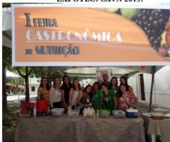
Foto 24. Equipe organizadora da I Feira Gastronômica de nutrição/CAVN 2019.

Parabéns as pessoas maravilhosas que fazem a diferença no Colégio Agrícola Vidal de Negreiros.