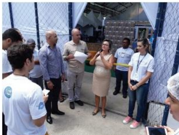
Foto 13. Abertura da XXVI EXPOTEC/CAVN 2019.

Por meio de estandes montados, os estudantes compartilharam seus projetos e ações nas áreas vegetal, animal e alimentar, levando em consideração a sustentabilidade, tema de extrema importância na atualidade. É sempre um momento de descontração a chegada dos visitantes na EXPOTEC. Na verdade, este evento já virou tradição para os Municípios de Solânea e Bananeiras.