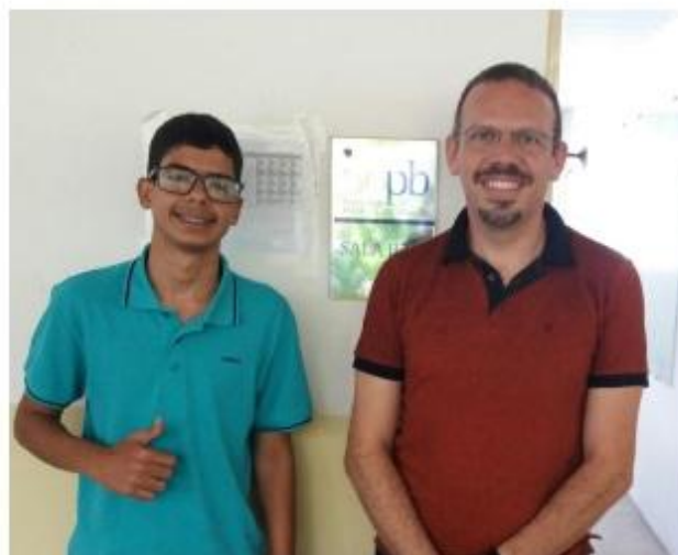
Foto 24. Participante da Olimpíada de Física/CAVN 2019.

Parabéns as pessoas maravilhosas que fazem a diferença no Colégio Agrícola Vidal de Negreiros.