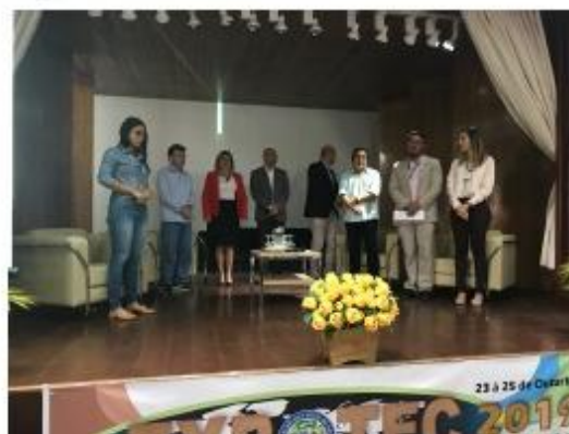
Foto 11. II Fórum de Ensino Básico e Profissional/CAVN 2019.