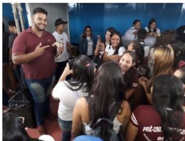
Foto 17. XXVI EXPOTEC/CAVN 2019.