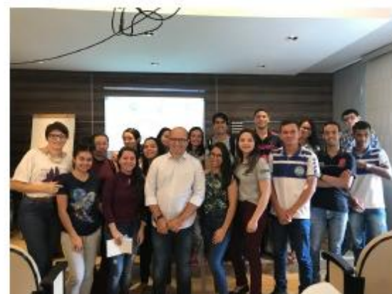
Foto 10. Realização da I Oficina Encontro Unificado/CAVN 2019.