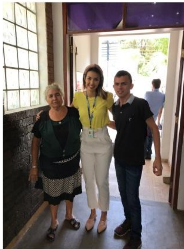
Foto 05. Encontro da Família Escola no CAVN, 2019.