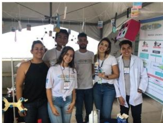
Foto 14. XXVI EXPOTEC/CAVN 2019.