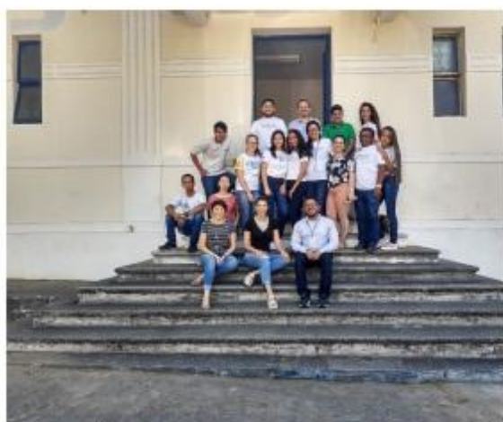
Foto 23. Representantes da equipe organizadora da XXVI EXPOTEC/CAVN 2019.