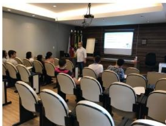
Foto 09. Realização da I Oficina Encontro Unificado/CAVN 2019.