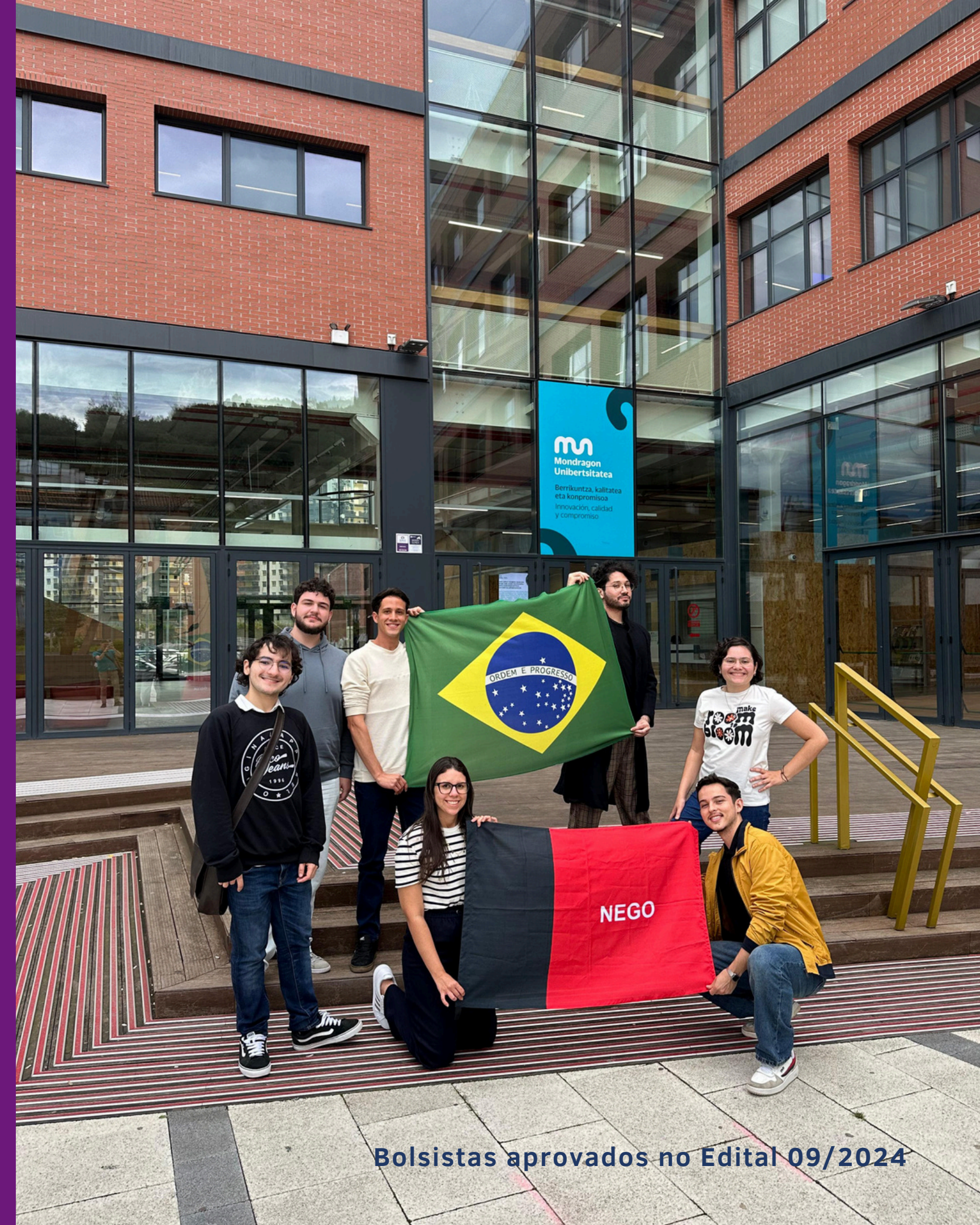
Bolsistas aprovados no Edital 09/2024