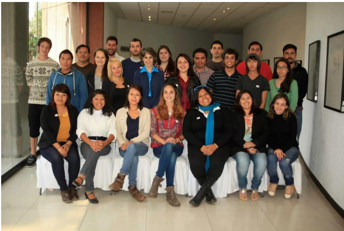
Turma da UAM azcapotzalco

Sinta-se à vontade para inserir algumas fotos que possam ilustrar o período do intercâmbio e incluir comentários/descrições sobre elas.