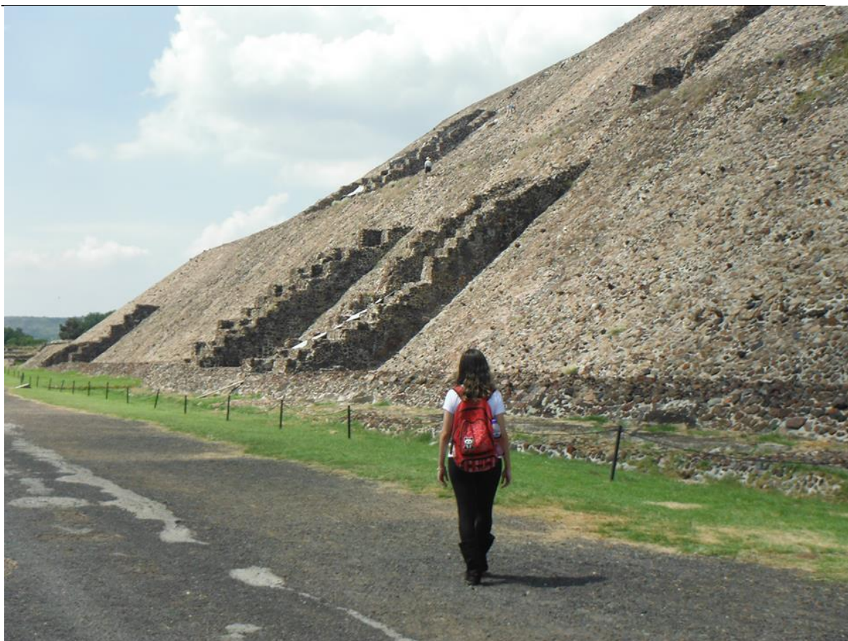
Pirâmides de Teotihuacan