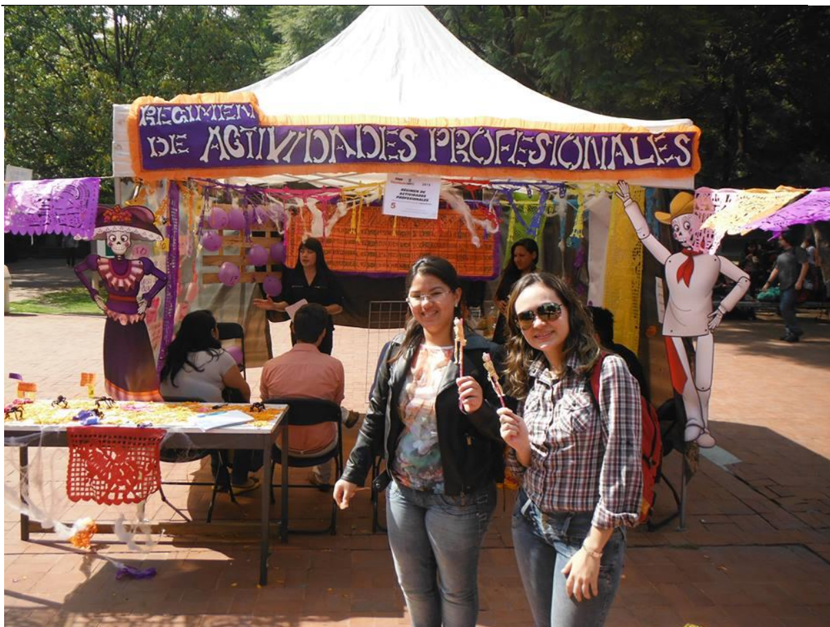
Feira de atividades profissionais, UAM Azcapotzalco