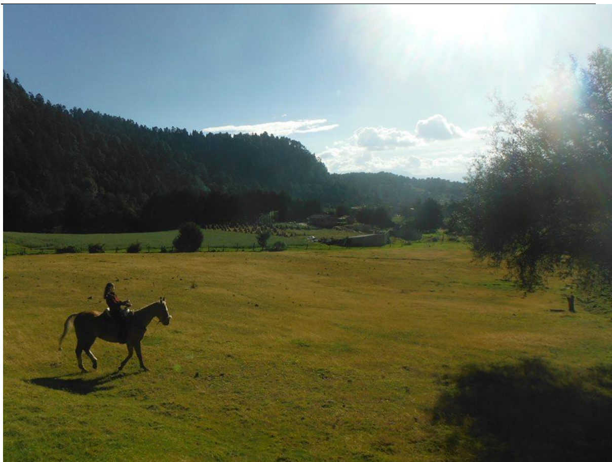
Passeio a cavalo, na Marquesa