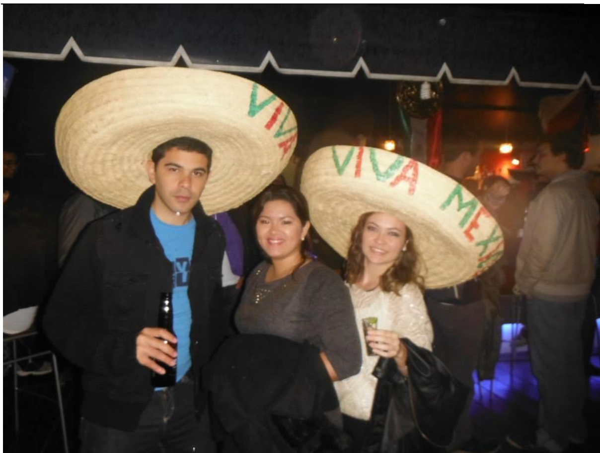
Dia da independência mexicana