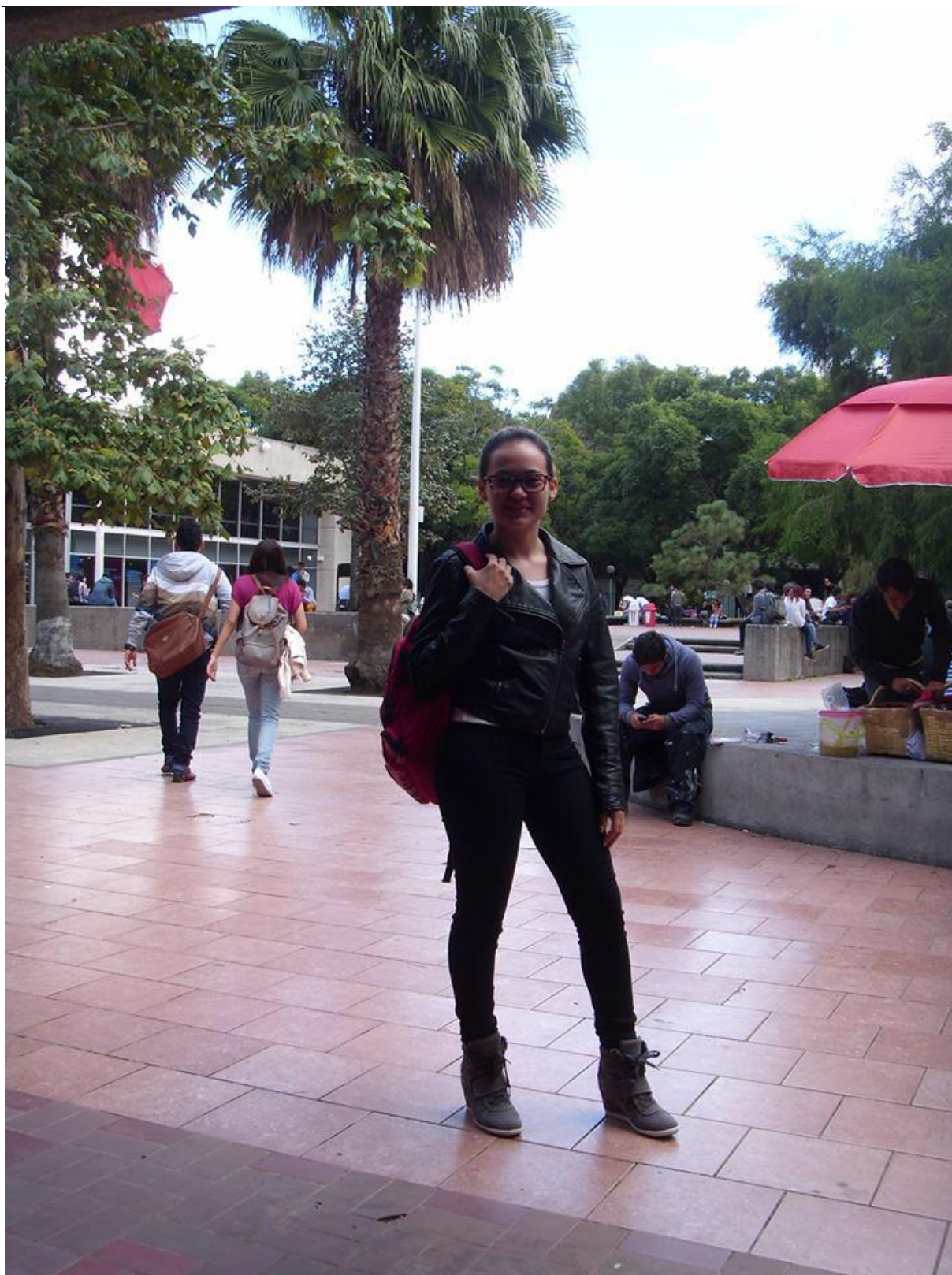
Dia de aula normal na UAM