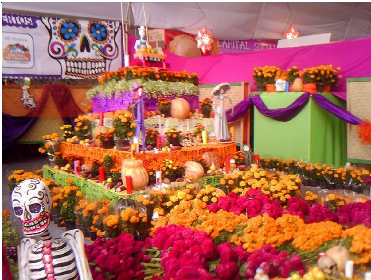
Oferenda do dia de mortos