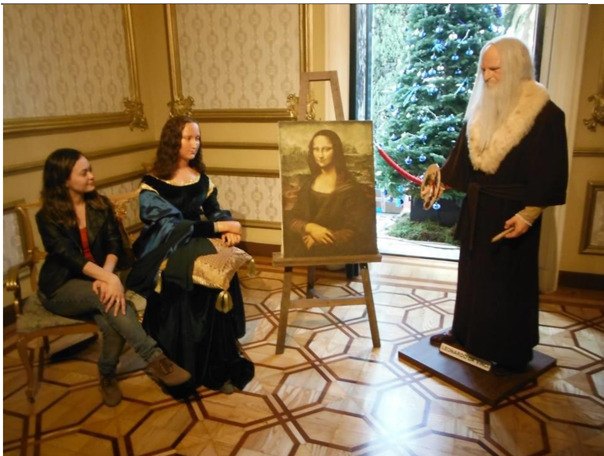
Museu de Cêra