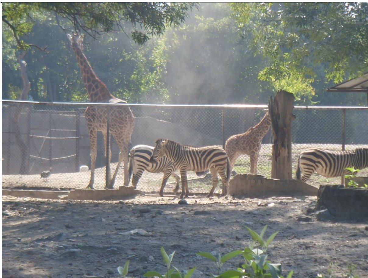
Bosque de Chapultepec, zoológico